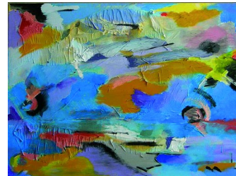
Himmel und Meer